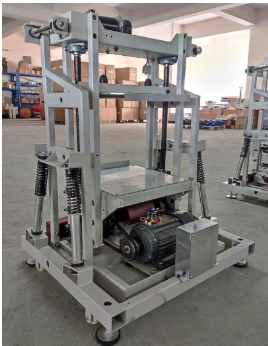
机芯与机箱分离，运行平稳。