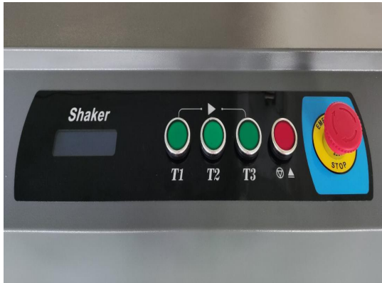
控制面板，操作简单