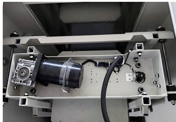
简单电气机构，维修方便。