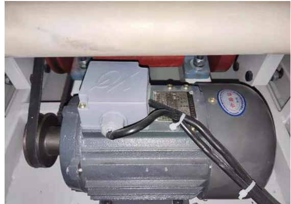
电机过热保护，有效延长电机寿命。